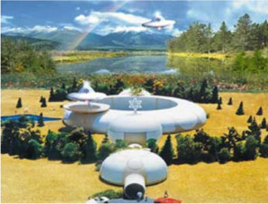
Modèle du Quartier

général proposé au mouvement raëlien à Jérusalem. Les Raëliens forment un culte ufologique [culte des extraterrestres].