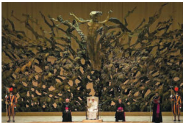
Le trône papal

Les pasteurs et les laïques tremblent de peur, trop effrayés que leur ville et leur communauté sachent leurs croyances. Pire encore, ils sacrifient ces croyances. L'IRS [Bureau des impôts américain] avertit les vraies Églises de la Bible qu'elles pourraient perdre leur statut d'exemption de taxe si elles sont « trop conservatrices ». La plupart se soumettent humblement.