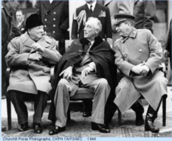
The Big Three

Très vite, il a fallu choisir si ce Nouvel Ordre Mondial tant attendu devait revêtir la forme « mauvaise » de la Magie Noire d'Adolf Hitler, ou la « bonne » forme de la Magie Blanche de Roosevelt et de Churchill ! Comme les occultistes des deux camps croient en la puissance exceptionnelle des « relations triangulaires », les principaux protagonistes de la Deuxième Guerre Mondiale se sont rapidement regroupés en deux « triangles » d'alliés : le Triangle Noir formé par l'Allemagne nazie, l'Italie et le Japon, contre le Triangle Blanc formé par les Etats-Unis, la Grande-Bretagne et la Russie. C'était la Magie Blanche qui luttait contre la Magie Noire !