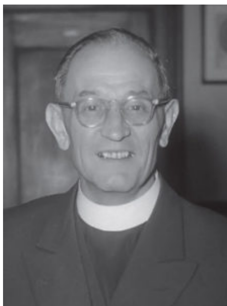
Le pasteur Martin Niemöller

« Quand l'Agneau eut ouvert le septième sceau, il se fit un silence dans le ciel d'environ une demi-heure » (Apocalypse 8:1).