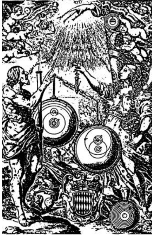
Les Systèmes du Monde en 1651 selon le Père Riccioli (Fac-similé réduit de la page frontispice de Almagestum Novum de Riccioli, Bologne 1651.)