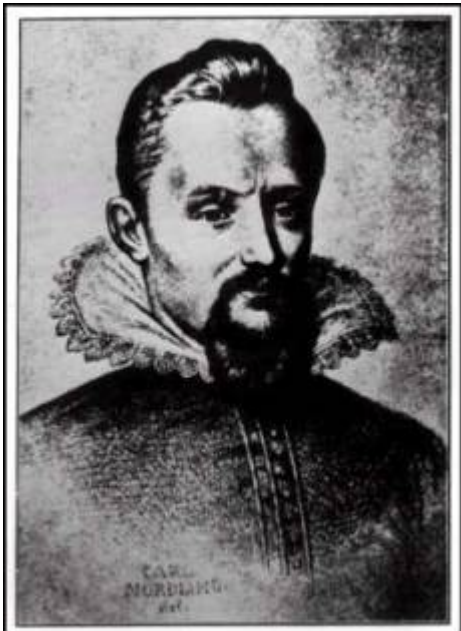
Figure clé au début de la bataille visant à remplacer la Terre immuable de la Bible par le système copernicien.

Kepler (1571-1630) fut l'assistant de Tycho Brahe durant les dernières années de la