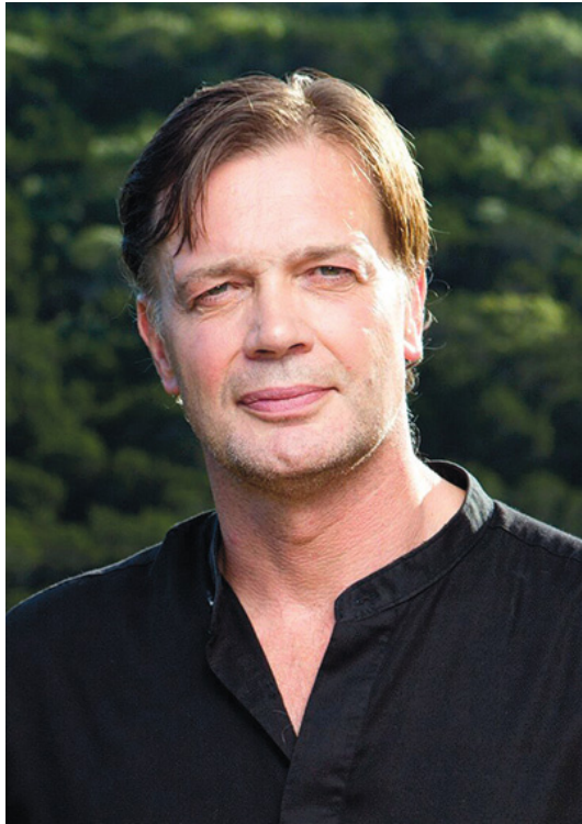
Le Dr Andrew Wakefield

Power of Prophecy a le plaisir de vous offrir un exposé explosif intitulé Vaxxed: From Cover-up to Catastrophe . [Nous pourrions le traduire en français par Vaxxiné : de la dissimulation à la catastrophe .] Le très estimé Dr Andrew Wakefield, le premier à signaler, en 1998, que le vaccin MMR (la rougeole, les oreillons et la rubéole) pouvait causer l'autisme, dirige ce documentaire.