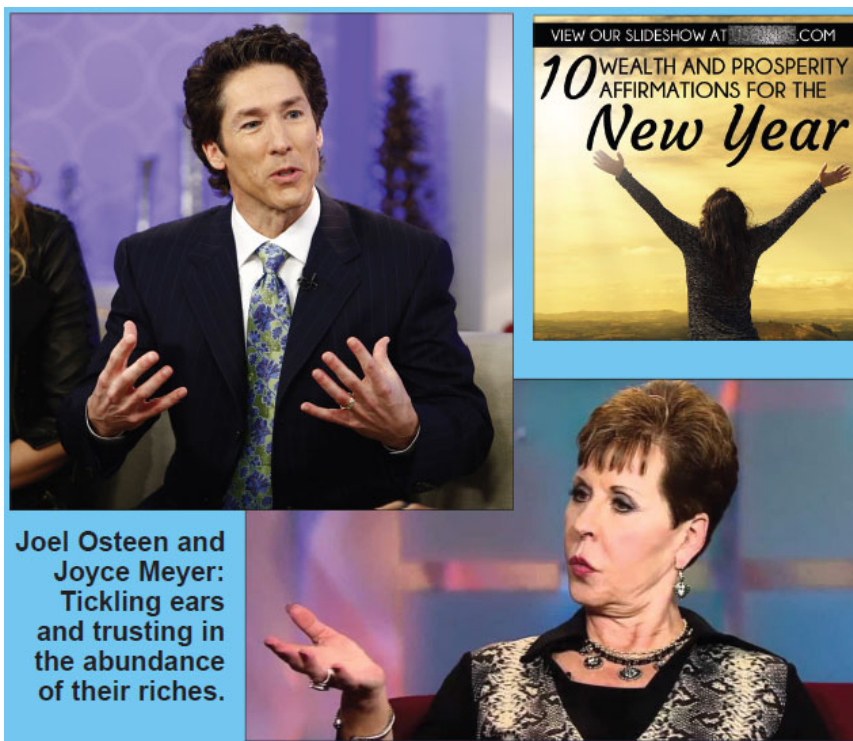
Joel Osteen and Joyce Meyer: Tickling ears and trusting in the abundance of their riches.

L'infiltration d'hommes tièdes, l'acceptation dans le pastorat de femmes et d'homosexuels, ce sont des buts de Satan. Des croyances libérales ont dilué la doctrine chrétienne jusqu'au point de saturation. La pseudo-chrétienté a remplacé tout ce qui ressemble à une vraie maison de culte.