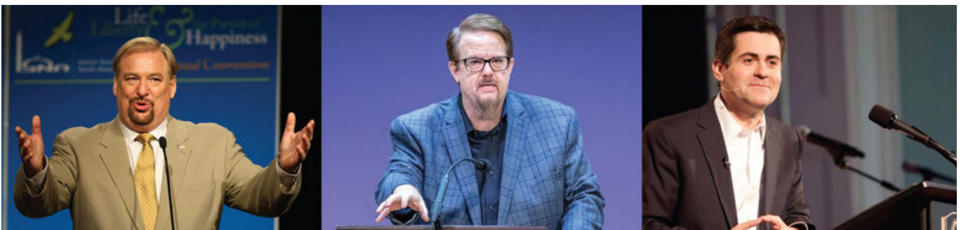
Rick Warren (à gauche), Ed Stetzer (au centre) et Russell Moore (à droite) -

Selon des leaders évangéliques comme Rick Warren, Tim Keller, Russell Moore, Ed Stetzer et d'autres, Francis Collins doit être loué comme héros et un frère en Christ. Il semble que ces suzerains cherchent à devenir compétents culturellement et acceptables aux yeux de tous. Pour être acceptés, ils ne doivent pas être une menace et répètent donc le narratif de Big Brother.