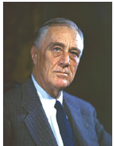
Roosevelt fut le seul Président à avoir été élu

Cela changea avec Franklin D. Roosevelt qui fut élu quatre fois. Des discussions sur les limites de mandat présidentiel débutèrent en 1944 et le 22 e Amendement fut adopté en mars de 1947. Cela semble être une loi inopportune pour un ancien Président.