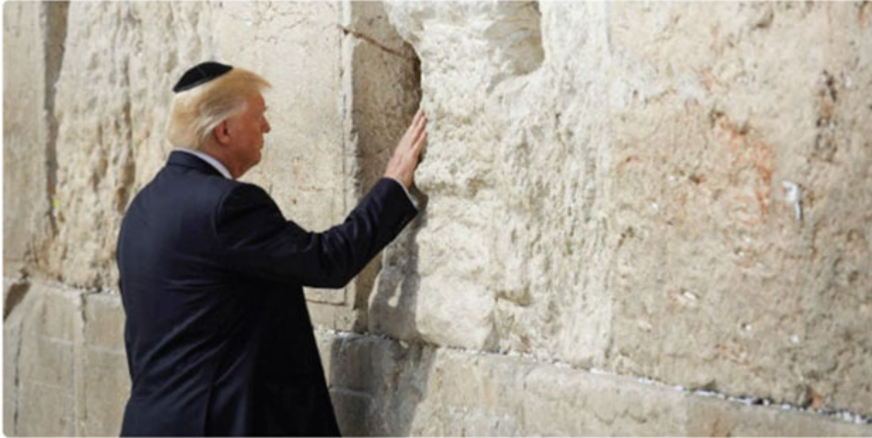
US President Donald Trump prays at the Western Wall

Home ( https://israel365news.com/ ) » Trump could Initiate Building of Third Temple as Head of Edom