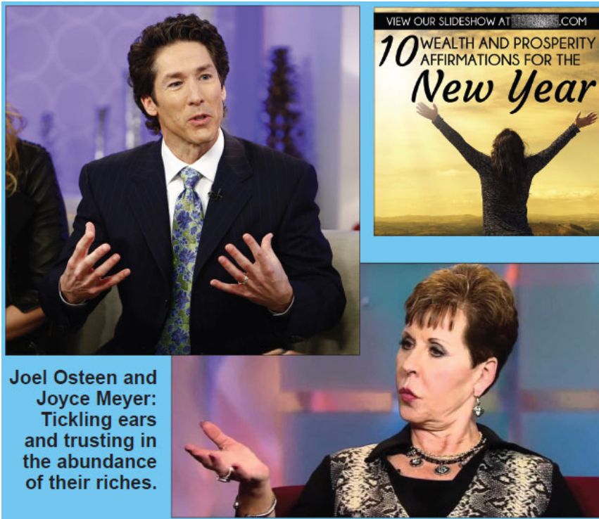
Joel Osteen and Joyce Meyer: Tickling ears and trusting in the abundance of their riches.