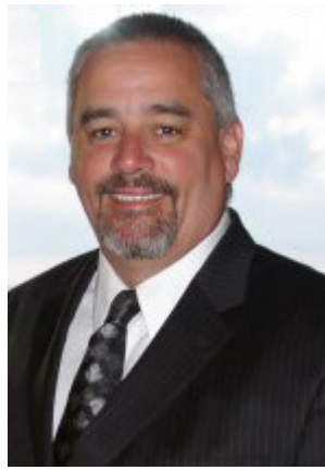
Par Jerry Barrett

« Résolution : ferme décision de faire ou de ne pas faire quelque chose. »