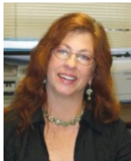
Par Sandra Myers

Parlez aux étrangers sur la rue de la gloire qui se trouve en Lui. Le temps se fait court et notre mission est de conduire le plus de gens possible vers Jésus.