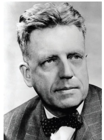
Alfred Kinsey, sexologue

La guerre contre la famille s'est accrue régulièrement au fil des derniers soixante ans. Les travaux d'Alfred Kinsey ont été loués comme étant une approche éclairée de la sexualité. La