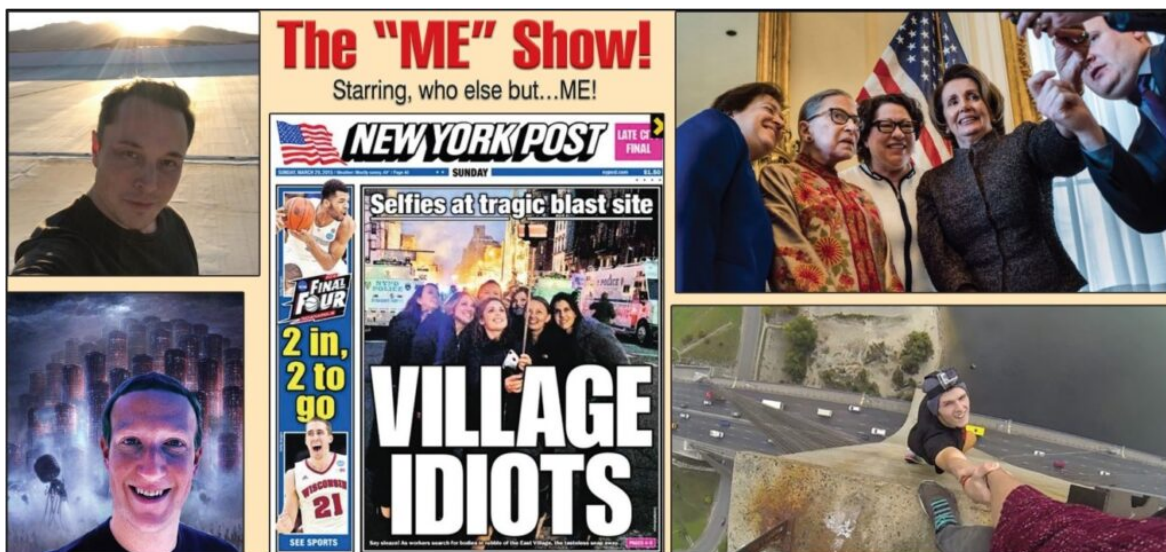
De gauche à droite : Elon Musk au sommet de sa giga-usine ;

La descendance de cette génération - appelée Milléniaux - est maintenant surnommée la « Génération du Moi, Moi, Moi ». Envolés les jours où l'on gagnait sa vie, et où l'on retirait de la fierté pour un travail bien fait. Au lieu de cela, on a remplacé ça par des trophées de participation découlant d'une populace encore plus égoïste.