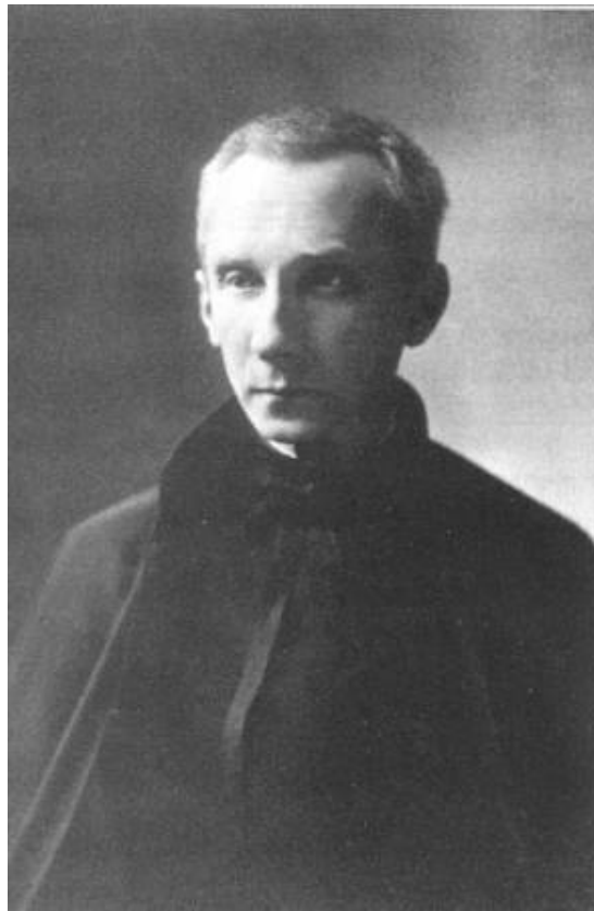
Wlodimir Ledochowski - Trente-sixième Jésuite Général de la Compagnie de Jésus 1915-1942

Le pape Jean-Paul II, communiste marxiste, a continué la progression entreprise par les papes Jean XXIII et Paul VI en direction d'un catholicisme marxiste. Quoique Paul VI ait cultivé des liens étroits avec Moscou, Jean-Paul II a choisi un communisme catholique plus indépendant de Moscou. C'est sa cassure avec Moscou qui a causé la tentative d'assassinat à son égard, le 13 mai 1981. Cela n'empêcha pas le Chœur de l'Armée rouge de se rendre au Vatican, le 16 octobre 2004, pour célébrer le 25 e anniversaire du pontificat de Jean-Paul II...!