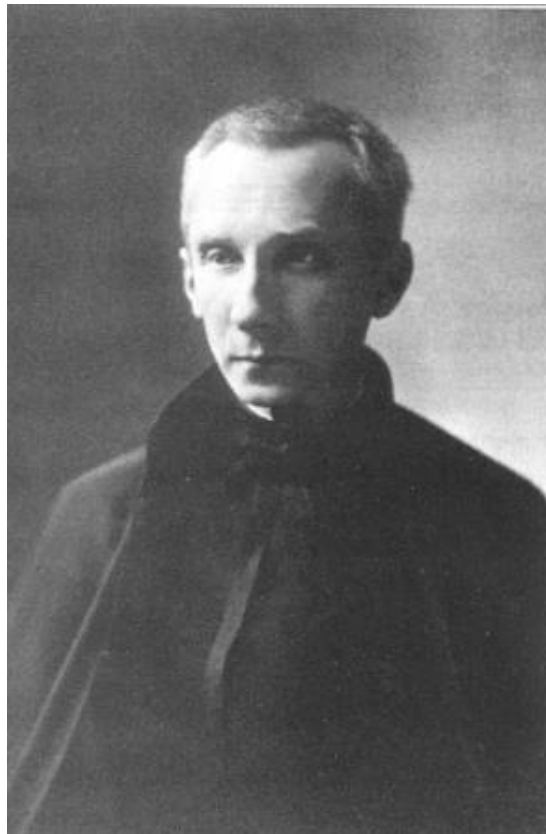
Wlodimir Ledochowski - Trente-sixième Jésuite Général de la Compagnie de Jésus 1915-1942

Le pape Jean-Paul II, communiste marxiste, a continué la progression entreprise par les papes Jean XXIII et Paul VI en direction d'un catholicisme marxiste. Quoique Paul VI ait cultivé des liens étroits avec Moscou, Jean-Paul II a choisi un communisme catholique plus indépendant de Moscou. C'est sa cassure avec Moscou qui a causé la tentative d'assassinat à son égard, le 13 mai 1981. Cela n'empêcha pas le Chœur de l'Armée rouge de se rendre au Vatican, le 16 octobre 2004, pour célébrer le 25 e anniversaire du pontificat de Jean-Paul II...!