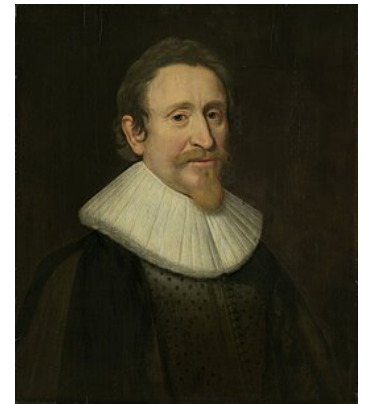
Hugo de Groot qui prit ensuite le nom d'Hugo Grotius

L'arminianisme affirme le paiement substitutif de Jésus pour les péchés dont les effets sont limités aux Élus seuls. Arminius croyait en la nécessité et la suffisance de l'expiation du Christ par