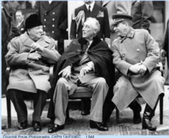
The Big Three

Très vite, il a fallu choisir si ce Nouvel Ordre Mondial tant attendu devait revêtir la forme « mauvaise » de la Magie Noire d'Adolf Hitler, ou la « bonne » forme de la Magie Blanche de Roosevelt et de Churchill ! Comme les occultistes des deux camps croient en la puissance exceptionnelle des « relations triangulaires », les principaux protagonistes de la Deuxième Guerre Mondiale se sont rapidement regroupés en deux « triangles » d'alliés : le Triangle Noir formé par l'Allemagne nazie, l'Italie et le Japon, contre le Triangle Blanc formé par les Etats-Unis, la Grande-Bretagne et la Russie. C'était la Magie Blanche qui luttait contre la Magie Noire !