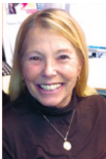
Par Michelle Hallmark Powell