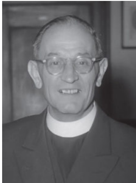
Le pasteur Martin Niemöller

« Quand l'Agneau eut ouvert le septième sceau, il se fit un silence dans le ciel d'environ une demi-heure » (Apocalypse 8:1).