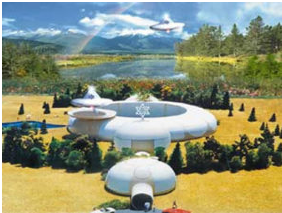
Modèle du Quartier

Miroir de l'Enfer - Empire global des bâtisseurs illuminati a été rédigé avec ce monde méchant en tête. C'est l'histoire de deux royaumes. Le premier, le plus large, est le royaume illuminati de Satan et j'explique avec des détails atroces la philosophie et la doctrine secrète des mauvaises gens qui sont les citoyens du royaume de Satan.