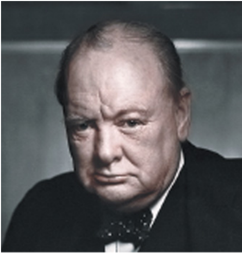
Sir Winston Churchill

L'histoire moderne du monde révèle le jeu de ces trois forces. Sir Winston Churchill dépeignit parfaitement la situation lorsqu'il écrivit que : « Depuis l'époque de Spartacus [nom de code d'Adam Weishaupt, fondateur des Illuminati de 1776], jusqu'à celle de Karl Marx en passant par Trotski, la conspiration mondiale pour le renversement de la civilisation s'est accru sans interruption. »