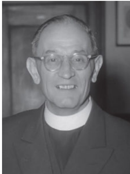
Le pasteur Martin Niemöller

« Quand l'Agneau eut ouvert le septième sceau, il se fit un silence dans le ciel d'environ une demi-heure » (Apocalypse 8:1).