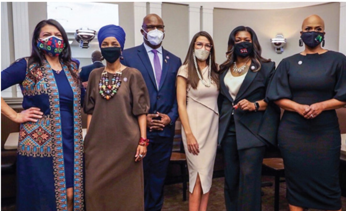
La Squad : Rashida Tlaib du Michigan, Ilhan Omar du Minnesota, Jamaal Bowman de New York, Alexandria Ocasio-Cortez de New York, Cori Bush du Missouri et Ayanna Pressley du Massachusetts.

La Squad (escouade) est constituée de démocrates progressifs socialistes. Ses membres ont demandé à grand cri que l'on définance la police. Ayanna Pressley du Massachusetts a commandité la Loi BREATHE qui vise à éliminer la loi fédérale sur le renforcement des agences. La représentante de New York, Alexandria Ocasio-Cortez, Ilhan Omar du Minnesota et Cori Bush du Missouri ont toutes élevé la voix pour en appeler de la fin de la loi sur le renforcement à travers le pays.